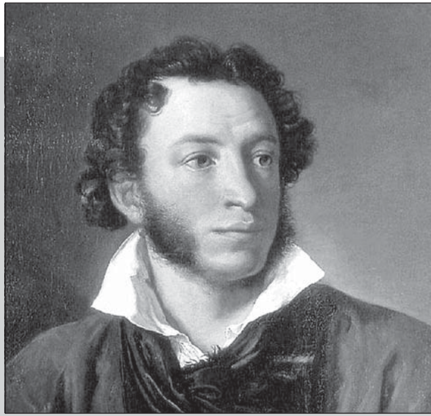
А. С. Пушкин. С картины художника Василия Тропинина.

■ Перед Днем защиты детей состоялся XV съезд уполномоченных по правам ребенка в российских регионах и, как рассказывает «Московский комсомолец», самой страшной проблемой, по словам главного детского омбудсмена страны Анны Кузнецовой, остаются преступления против половой неприкосновенности несовершеннолетних – их число в этом году снова выросло. Вообще, в 2017 году Следственный комитет РФ расследовал более 19 тысяч преступлений против несовершеннолетних, в том числе 374 убийства, 1619 изнасилований, 5 тысяч насильственных действий сексуального характера в отношении детей и подростков.