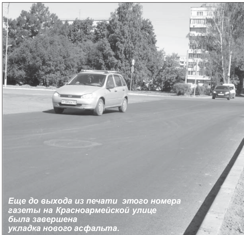
Еще до выхода из печати этого номера газеты на Красноармейской улице была завершена укладка нового асфальта.

ролитовской. Финансирование этого большого проекта из областного бюджета запланировано на два года. Причем лишь 3,5 месяца отводится непосредственно на дорожные работы, которые будут проводиться в будущем году. А в 2018 году начнется перекладка и обустройство инженерных коммуникаций (телефонные