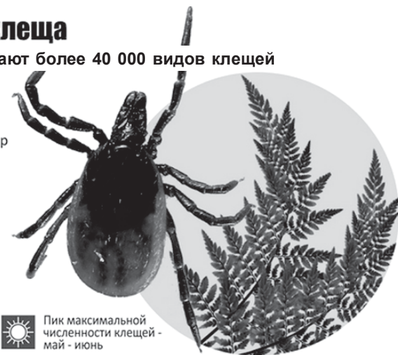
Пик максимальной численности клещей - май - июнь