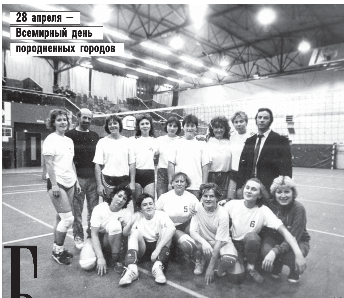
28 апреля – Всемирный день породненных городов