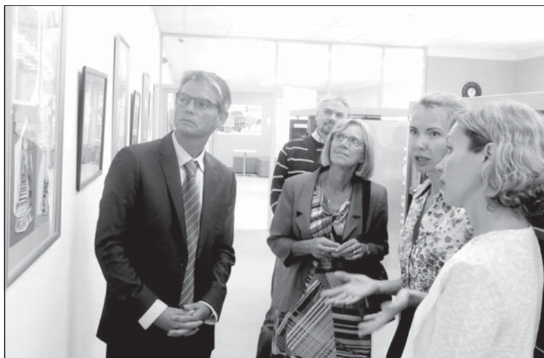
Мэр города-побратима Эрзувиль-Сен-Клера Родольф Тома и члены французской делегации в социокультурном центре «Тэффи».

ВФПГ – неправительственная организация. Ее целью является содействие развитию дружественных связей между городами различных стран в области экономического и культурного сотрудничества, образования, медицины, спорта, защиты окружающей среды и так далее. В федерации принимают участие как отдельные члены-города, так и коллективные – ассоциации или иные объединения городов. Цели и задачи ВФПГ