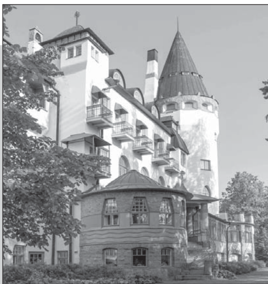
Иматра – город-побратим Тихвина. Замок-гостиница «Иматран Валтионхотелли».

■ В России завершилась самая массовая проверка молочной продукции, инициированная правительством. Как стало известно «Российской газете», львиная доля молочного фальсификата проходит через систему госзакупок, так как ключевым фактором победы на торгах в этой системе является цена. Проблема в том, что руководители госорганизаций, в том числе детских садов, школ и больниц, сами заинтересованы в покупке наиболее дешевого продукта, поскольку сэкономленные деньги обычно перераспределяют в виде премий среди сотрудников. Они и есть главные бенефициары от поставок фальсификата.