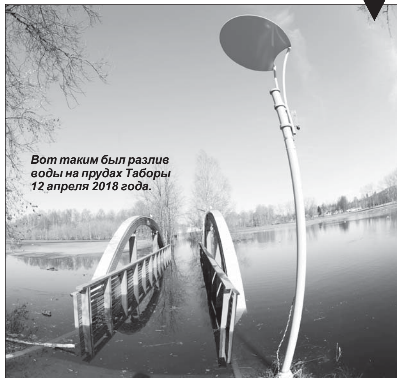
Вот таким был разлив воды на прудах Таборы 12 апреля 2018 года.