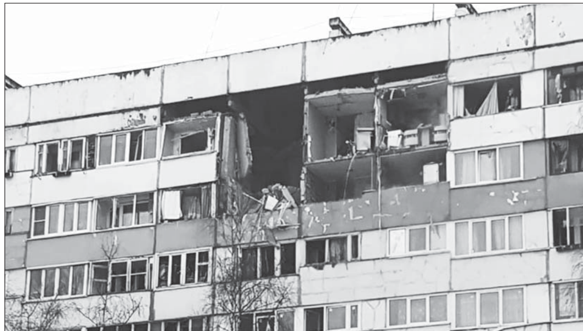
Вот к таким разрушениям привел произошедший 13 марта 2018 года взрыв бытового газа в многоквартирном доме на проспекте Народного ополчения в Санкт-Петербурге.