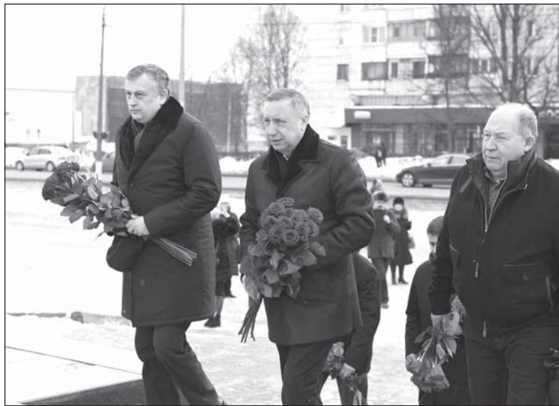
Александр Дрозденко, Александр Беглов и почетный гражданин Ленинградской области Виктор Кирьянов на площади К.А.Мерецкова возлагают цветы к стеле «Город воинской славы».

Отрадно, что в Тихвинском районе развивается и промышленность, и сельское хозяйство. Высокой похвалы заслуживает политика местных властей в благоустройстве территорий Тихвина с привлечением к этим вопросам населения. Положительные моменты можно перечислять и перечислять [47]