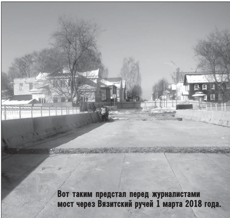
Вот таким предстал перед журналистами мост через Вязитский ручей 1 марта 2018 года.