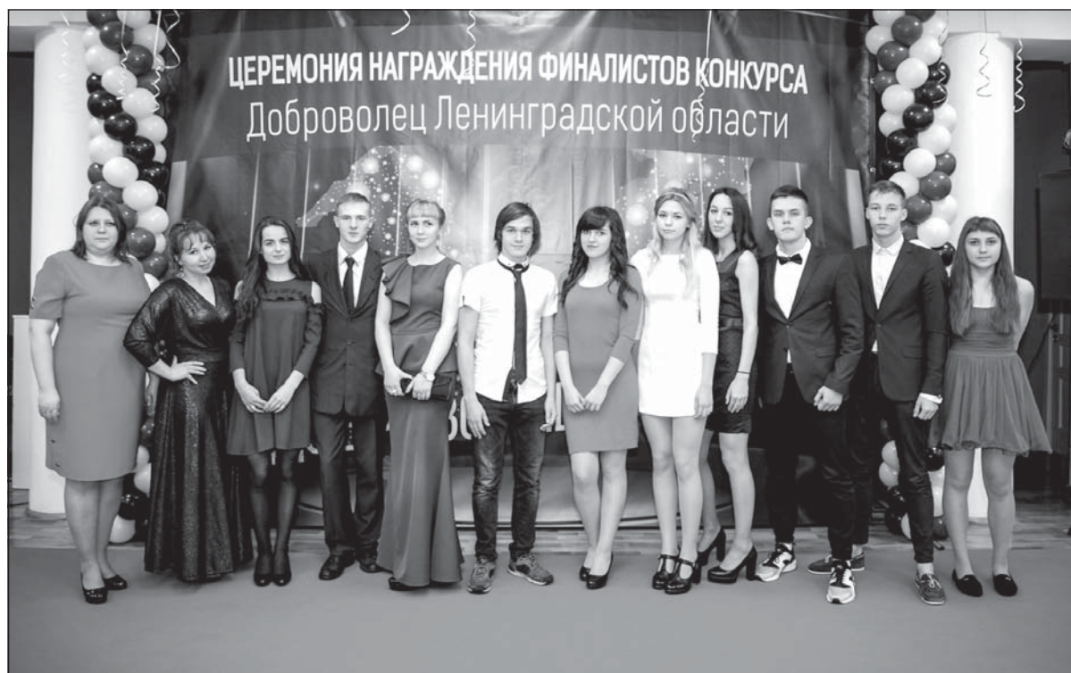
ЦЕРЕМОНИЯ НАГРАЖДЕНИЯ ФИНАЛИСТОВ КОНКУРСА Доброволец Ленинградской области