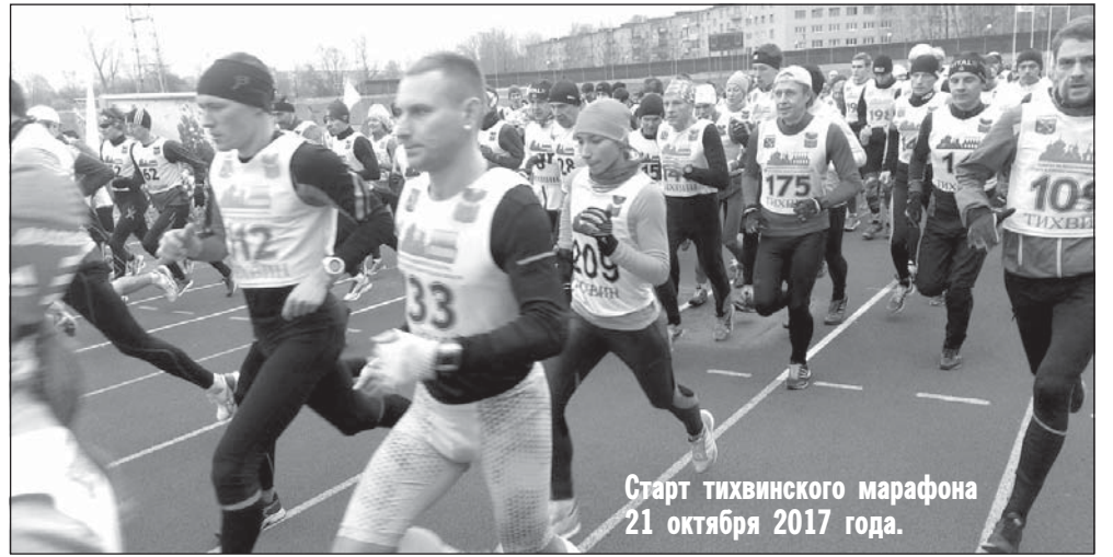
Старт тихвинского марафона 21 октября 2017 года.

Ознакомиться со всеми результатами, внесенными в протоколы XII Тихвинского марафона, можно на страничке ВКонтакте ( https://vk.com/event127162264 ).