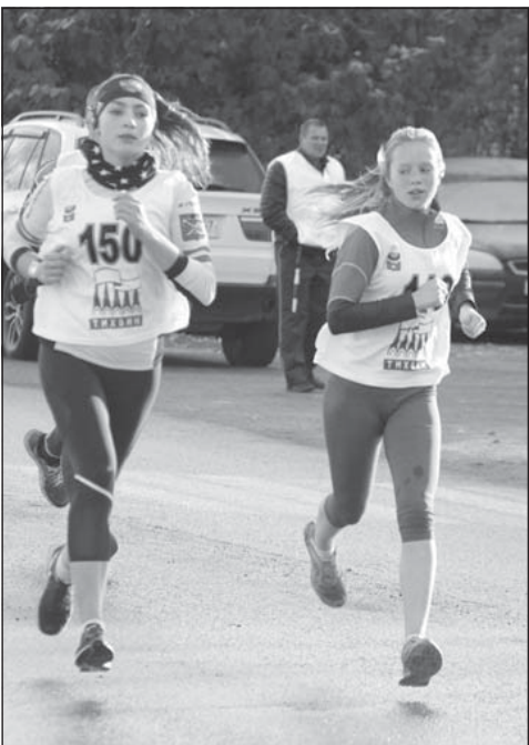
...ница в полумарафоне, уступившая... в мужской группе