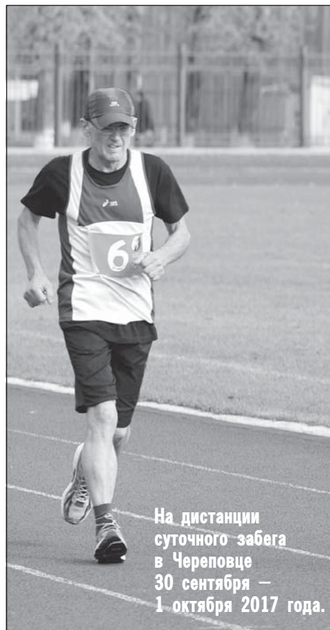
На дистанции суточного забега в Череповце 30 сентября – 1 октября 2017 года.