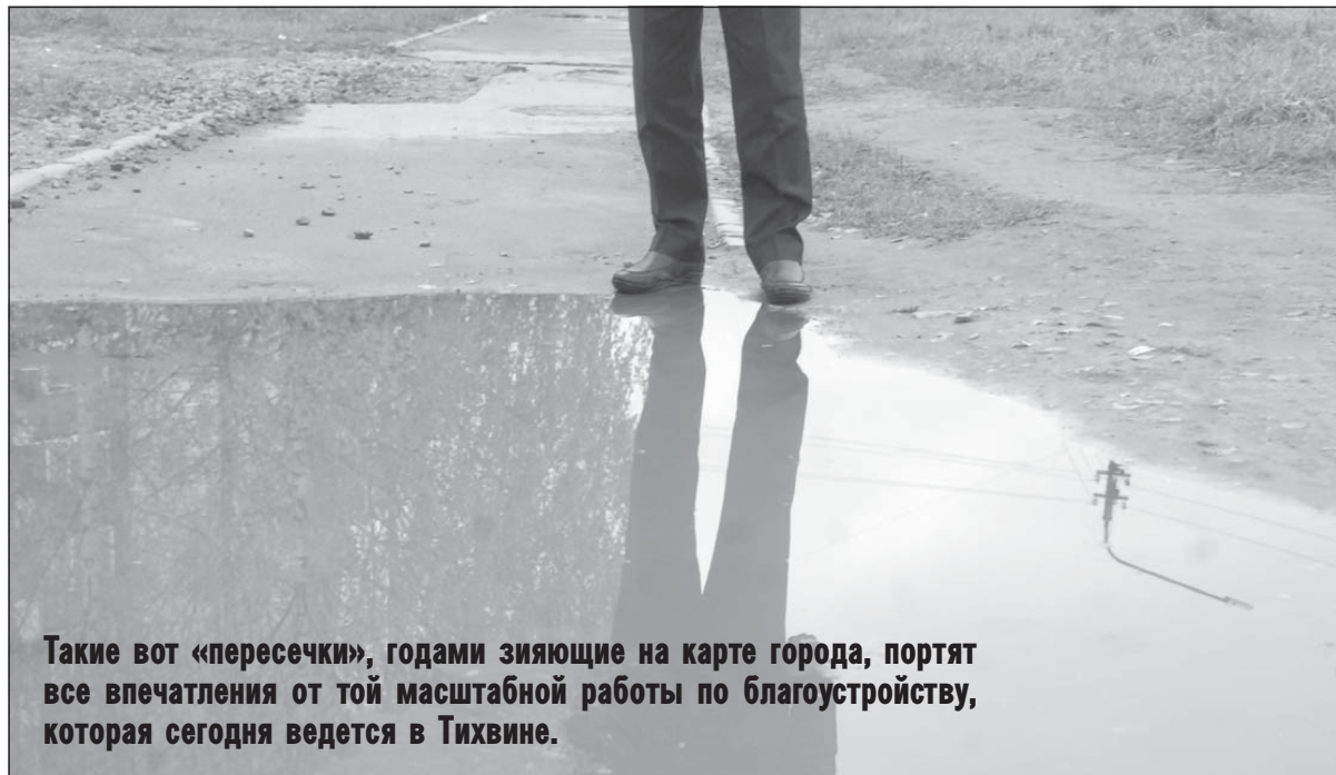
Такие вот «пересечки», годами зияющие на карте города, портят все впечатления от той масштабной работы по благоустройству, которая сегодня ведется в Тихвине.