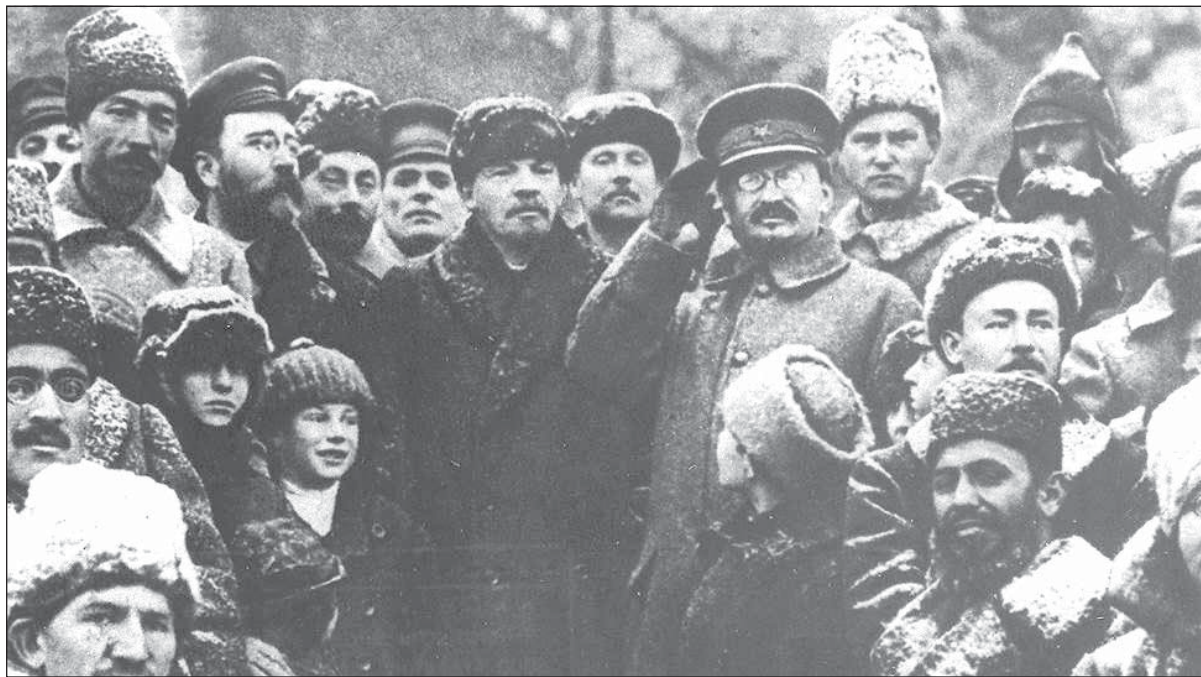
В центре на снимке – вожди Октябрьской революции Ленин и Троцкий.

революции высказали и представители церкви, главным посылом которых была также «идея примирения на основе религии»: «Когда-то разрушение храмов, массовые убийства верующих стали ужаснейшей страницей национального разделения, теперь мир должен стать олицетворением согласия и взаимного прощения – белых с красными, верующих с неверующими, богатых с бедными», – сказал патриарх на заседании Высшего церковного совета Русской православной церкви в храме Христа Спасителя.