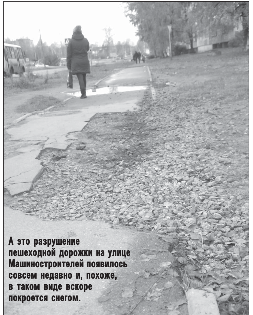
А это разрушение пешеходной дорожки на улице Машиностроителей появилось совсем недавно и, похоже, в таком виде вскоре покроется снегом.

* Имеются в виду обращение, опубликованное 13 сентября под заголовком «За помощью – к депутату», и ответ на него («Ответ депутата» – «Трудовая слава», 25.10.2017).