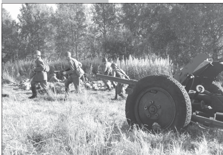
Реконструкция боя, проведенная 24 сентября 2017 года.

События 1942 года на Невском пятачке воссоздали участники военно-исторического фестиваля «Забывтый подвиг», автора же статьи они натолкнули на воспоминания о первом посещении легендарного плацдарма, произошедшем 52 года назад.