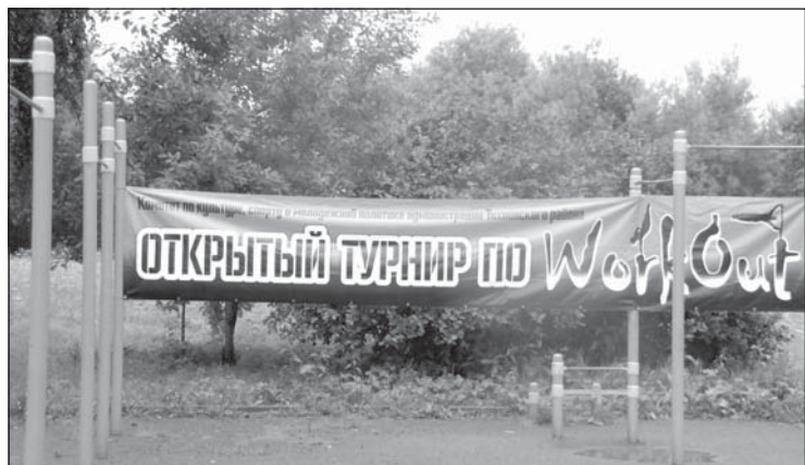
12 августа 2017 года. Несмотря на дождливую погоду, нашлось немало желающих принять участие в четвертом открытом турнире по воркауту, в том числе из Бокситогорского района и города Пикалево.