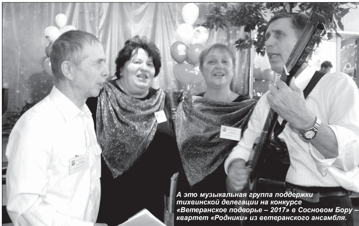
А это музыкальная группа поддержки тихвинской делегации на конкурсе «Ветеранское подворье – 2017» в Сосновом Бору – квартет «Родники» из ветеранского ансамбля.

Материал подготовлен по заказу комитета по печати и связям с общественностью Ленинградской области.