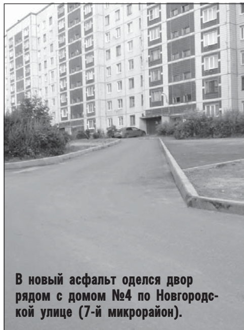
В новый асфальт оделся двор рядом с домом №4 по Новгородской улице (7-й микрорайон).

Ответ получен и, по крайней мере, обратившимся в редакцию письмам понятно, что любоваться на лужу и преодолевать ее как преграду им придется еще четыре года, если в комитете ЖКХ администрации Тихвинского рай-