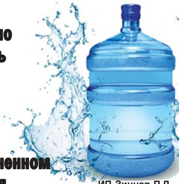
ИП Зиннер П.Д.

Наша вода — мягкая и приятная на вкус, при ее кипячении совершенно не образуется накипь. Ее можно пить без кипячения. Рекомендуется для приготовления пищи, для людей любого возраста, имеет достаточно низкий уровень минерализации, что позволяет пить воду в неограниченном количестве без ущерба для здоровья.