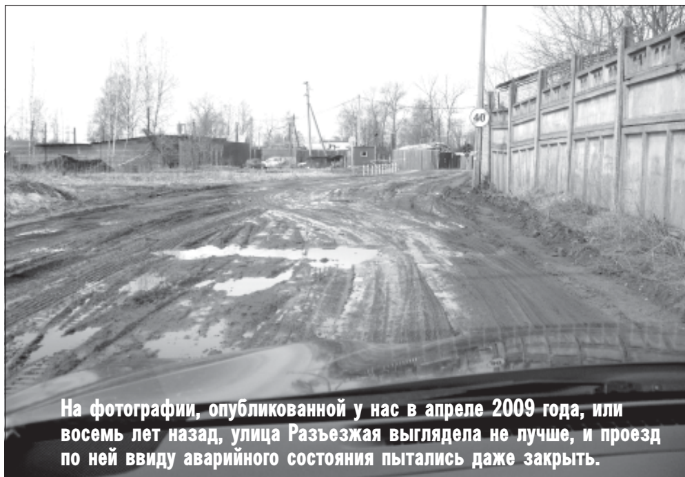
На фотографии, опубликованной у нас в апреле 2009 года, или восемь лет назад, улица Разъезжая выглядела не лучше, и проезд по ней ввиду аварийного состояния пытались даже закрыть.

От редакции. Забытая властью окраина. Этой теме еще десятилетие назад мы посвятили не одну публикацию – и в «Трудовой славе», и в выходящей в то время газете «Северо-Восток (регион)», пытаясь обратить внимание муниципалитета на неблагоустроенные улицы старой части города, в том числе Разъезжей. «И если, писали мы, городская власть уделяет внимание благоустройству микрорайонов, то жители окраины нередко обделены таким вниманием». Конкретно касаясь улицы Разъезжей, напомним, что в упомянутом на фотографии 2009 году, как сообщал нам один из тогдашних руководителей городской администрации, намечен ее ремонт (!?).