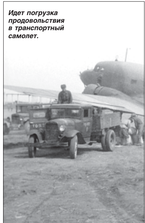
Идет погрузка продовольствия в транспортный самолет.

160-й истребительный полк в конце декабря 1941 года, потеряв почти все самолеты и большую часть летчиков, был выведен из боев и до конца февраля 1942 года находился под Москвой на доукомплектовании.