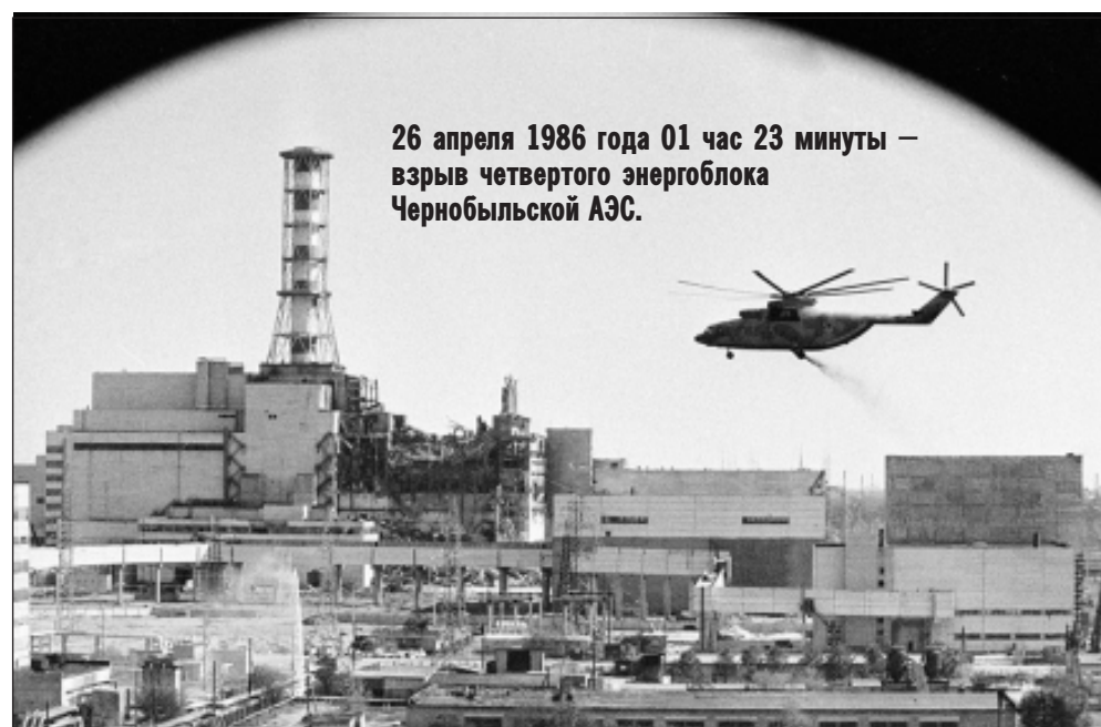
26 апреля 1986 года 01 час 23 минуты – взрыв четвертого энергоблока Чернобыльской АЭС.