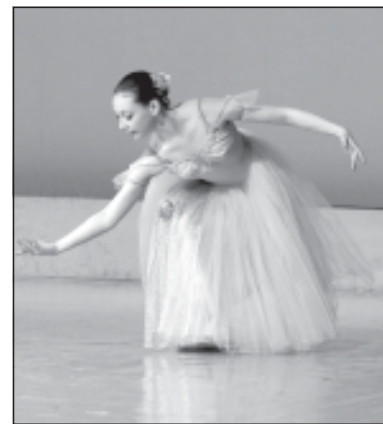
Полосу подготовила Полина СМЕРНОВА.

* Пачка (балетная) – жесткая юбка, используемая танцовщицами.