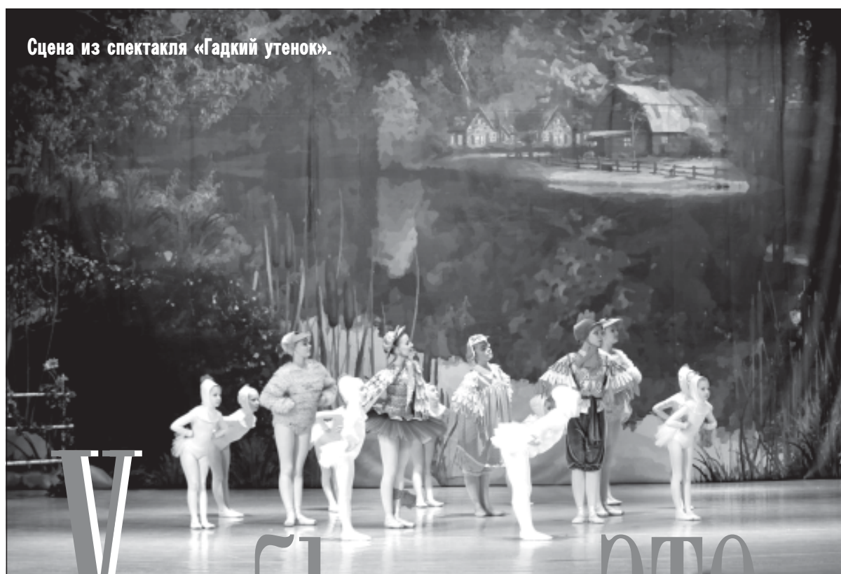
Сцена из спектакля «Гадкий утенок».

На вопрос о том, сложно ли попасть в ансамбль, его руководитель говорит, что никакого отбора не проводит. Занятия, репетиции ежедневно отнимают много времени и сил, так что дети приходят и уходят. К тому же балетные пачки* стоят дорого, приходится заказывать у портних в Петербурге – опять же зат-