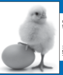
ИП Нахкимов Ю.В.

кур-молодок и несушек рыжих и белых, петухов, цыплят бройлеров, утят, гусят, индюшат, цесарок, перепелов. Корм для молодняка птицы. Доставка.