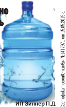
ИП Зиннер П.Д.

Наша вода – мягкая и приятная на вкус, при ее кипячении совершенно не образуется накипь. Ее можно пить без кипячения. Рекомендуется для приготовления пищи, для людей любого возраста, имеет достаточно низкий уровень минерализации, что позволяет пить воду в неограниченном количестве без ущерба для здоровья.