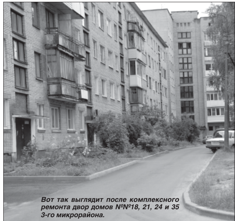
Вот так выглядит после комплексного ремонта двор домов №№18, 21, 24 и 35 3-го микрорайона.

Самый большой объем работы запланирован на 2021 год – одиннадцать объектов. Это дворы у домов №№4, 5, 35 и 50-а 1-го микрорайона, домов №№12 и 13 4-го микрорайона, №№6, 7 и 8 3-го микрорайона, №№16 и 35 4-го микрорайона, №№10, 11 и 12 5-го микрорайона, №№2, 20 и 21 6-го микрорайона, Усадьба РТС. Намечено также отремонтировать дворовые территории в поселках Березовик на улице Подгаецкого, Царицыно Озеро, Красава и Сарка.