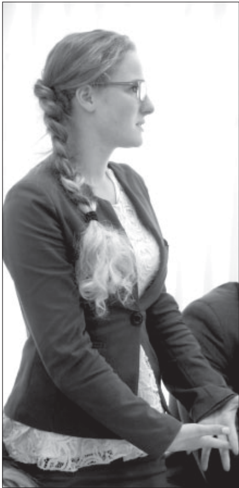
2-я стр. →

Спрашивали о законодательских инициативах, о том, чем занимается сенатор, как формируется областной парламент, но постепенно от общих тем они перешли к конкретным. Вопросы касались профориентации, резонансных законопроектов (таких, как нашумевший «Пакет Яровой», обязывающих операторов мобильной связи хранить данные), а также волнующего выпускников единого государственного экзамена. Спрашивали школьники и о перспективах возведения в городе физкультурно-оздоровительного комплекса.