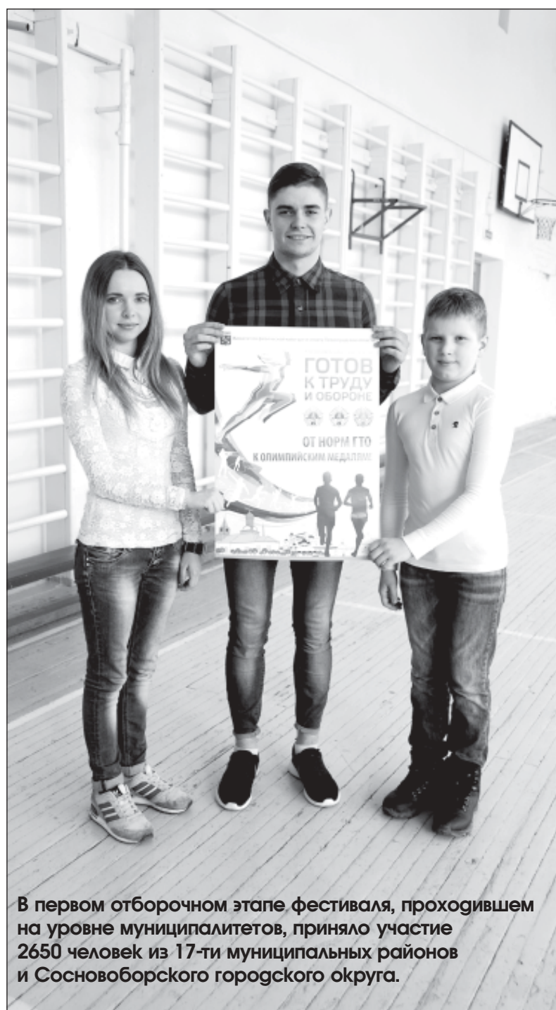
В первом отборочном этапе фестиваля, проходившем на уровне муниципалитетов, приняло участие 2650 человек из 17-ти муниципальных районов и Сосновоборского городского округа.

Позади – первый в новейшей истории Ленинградской области этап внедрения Всероссийского физкультурно-спортивного комплекса «Готов к труду и обороне»